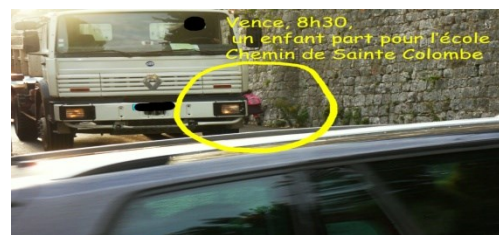
Sainte Colombe 2017