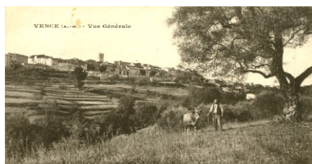
Sainte Colombe 1905